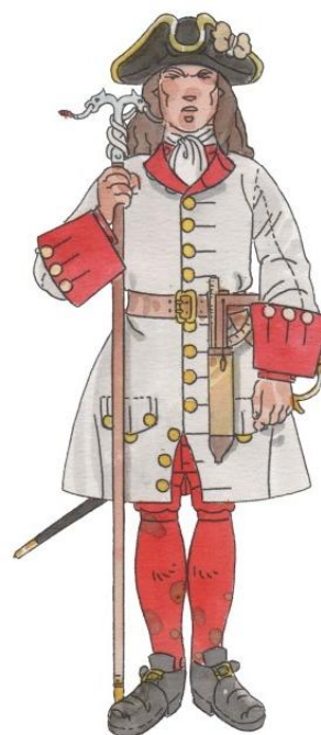
Regiment d'Artilleria 1709