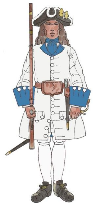
Regiment Rubí recluta de Mallorca 1713