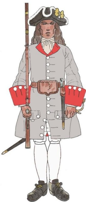
Regiment de Districte Josep A. de Rubí 1707