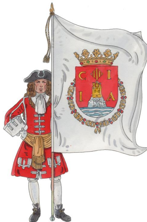
Alferes abanderat amb la Bandera del Regiment

El 30 de novembre de 1708, el general francès François Bidal d'Asfeld amb 12.000 homes comença el setge d'Alacant. La ciutat està defensada per soldats del regiment John Richards i fusellers de muntanya; el castell per 1.300 soldats anglesos del regiment Charles Hottam i hugonots del regiment Frederic Sybourg. La defensa de ciutat i castell és a càrrec del general John Richards, governador d'Alacant i del castell.