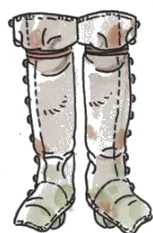
Calcilles de roba