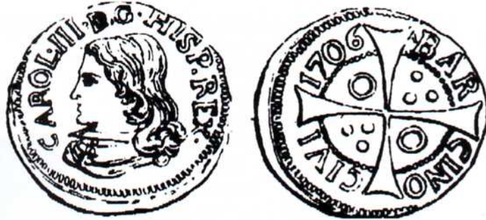
Croat de Carles III d'Àustria, moneda encunyada a la ceca de Barcelona, l'any 1.706, amb l'efígie del rei dels catalans.

Perduda la guerra, molts catalans s'exili- en i troben acollida a la cort de Viena i per tot l'imperi, participant en les campanyes contra els turcs.