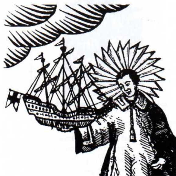
Imatge de Sant Vicenc Barquer, sostenint un vaixell que enarbora la bandera amb la creu de Sant Jordi, pròpia de la Generalitat de Catalunya.