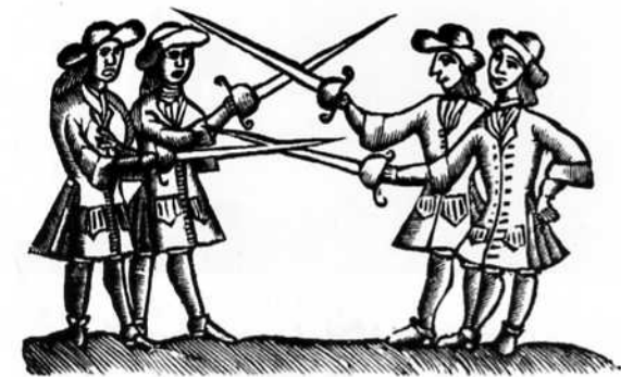
Al segle XVII l'espasa i el sabre eren encara armes de combat eficaces.

Després d'haver arribat a constituir-se en República, Catalunya accepta de mantenir l'estatu quo anterior en no trobar una sortida millor.