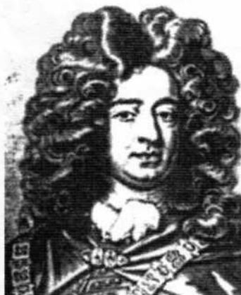
El príncep Jordi de Hessen-Darmstadt.