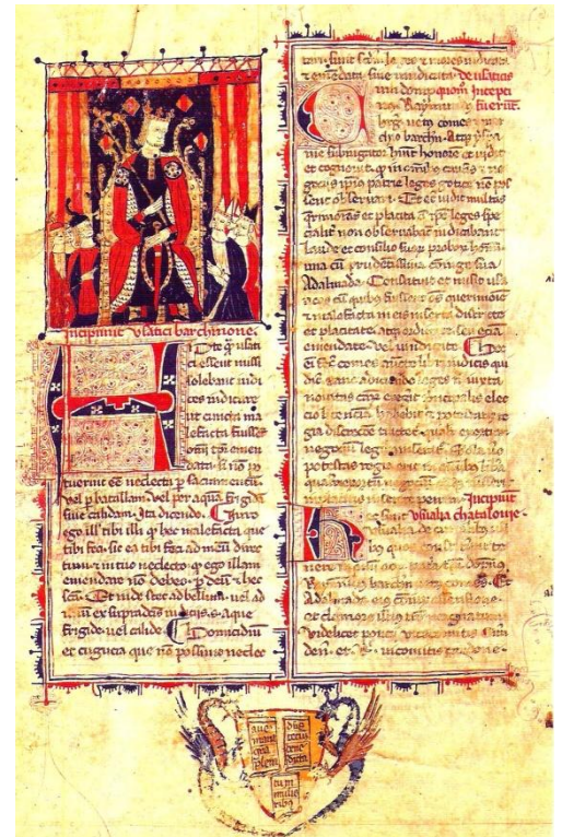
Usatges de Barcelona 1173

"...reducir estos reinos de que se compone España al estilo y leyes de Castilla, sin ninguna diferencia, que si Vuestra Majestad lo alcanza será el Príncipe más poderoso del mundo..."