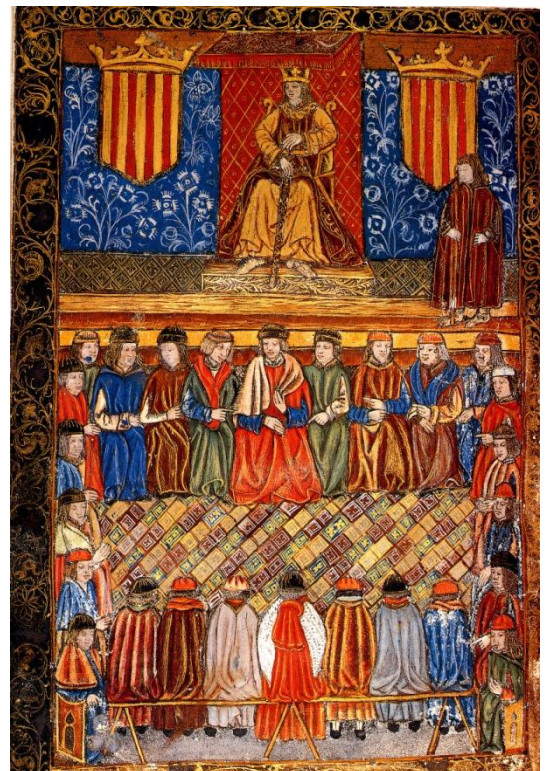
Corts catalanes, Ferran II 1495

És l'antítesi de l'axioma imperant a la resta d'Europa de " la paraula del rei és llei ".