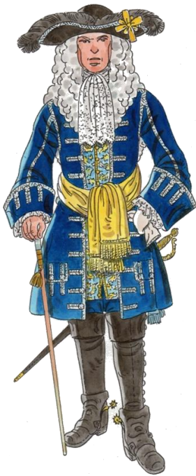
Antoni de Peguera i d'Aimeric Marquès de Foix

Barcelona, 1680 o 1681 1 – València, 15 de març de 1707