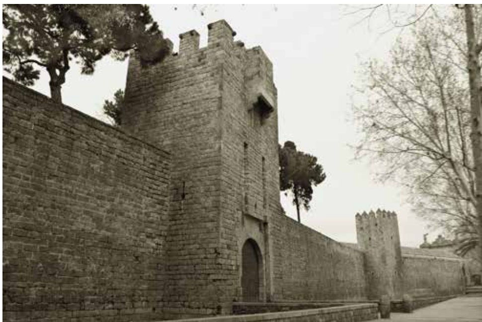
Portal de Santa Madrona en l'actualitat

El 7 d'abril, dia previ a l'atac, entre les 4 i les 5 de la tarda, Antoni Desvalls, seguit pels fusellers de Bac de Roda, Mas de Roda i Rau, van atacar l'exèrcit borbònic que procedents del portal de Santa Madrona es dirigien cap al castell de Montjuïc. Els soldats de la Coronela i els de les Reials Guàrdies Catalanes els van fer fora de tota la muntanya, aconseguint recobrar Santa Madrona, on va continuar la lluita tota la tarda fins a arribar als peus de la muntanya, tot i que, no obstant, els francesos van aconseguir mantenir-se forts a Santa Madrona. 3