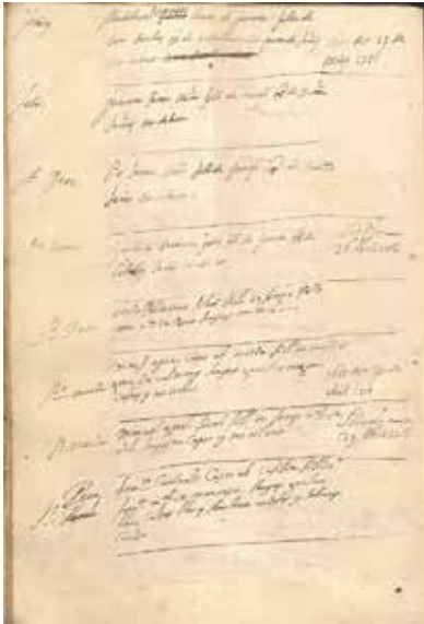
Notes. Foto 2

Apareix el seu ingrés en el llibre de paisans de l'hospital 4 i, juntament amb ell, hi ha registrades onze persones més, ja fossin per malaltia o ferits en batalla. En el llibre de registres de soldats d'aquell mateix dia apareixen els ingressos de 40 ferits més originaris de diverses poblacions de Catalunya i d'Itàlia, principalment de Nàpols i Calàbria.