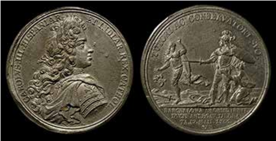
Medalla commemorativa de l'alliberament del setge de Barcelona 1706

El dia 15 de maig va tenir lloc a la catedral de Barcelona una solemne processó amb l'assistència del rei Carles, el bisbe de Solsona amb els abats, el capítol de la catedral, tot el clergat, generals i consellers de la ciutat, diputats, Reials Guàrdies Catalanes i una representació dels gremis portant ciris encesos. Amb tal motiu es va decretar per primer cop des que van començar els atacs, el toc de campanes de totes les esglésies i les de totes les ciutats i pobles del Principat. Catalunya celebrava que havia guanyat la batalla, però no va guanyar la guerra.