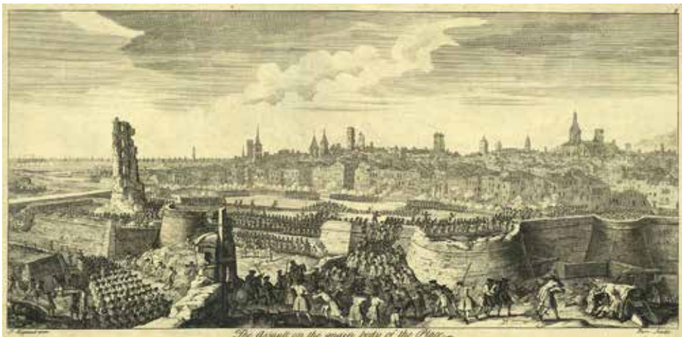
Assalt final. Jacques Rigaud. Assalt al cos de la plaça

Amb les tropes borbòniques ja dins de la ciutat, l'exèrcit català i els ciutadans segueixen oferint resistència intentant emparar-se darrere les primeres edificacions construïdes a manera de muralla. Els combats continuen, però ara tots, homes, dones i nens podien veure les cares dels seus botxins ni que fos per un instant. Malgrat l'horror i la barbàrie d'una guerra ja no tenen res a perdre, o potser sí, la pròpia vida. Saben que hauran de fer front a l'absència dels seus éssers estimats, la pèrdua de les seves cases, les poques o moltes pertinences que poguessin tenir, la seva dignitat i tot l'esforç que representa, en si mateix, el fet de viure. Les ordres rebudes eren de saquejar, incendiar i matar els habitants, com ja havien fet en altres poblacions per on havien passat, però aquestes ordres no van ser seguides estrictament perquè les mateixes tropes atacants estaven esgotades d'una lluita tan llarga, a més d'anímica i moralment desgastades d'haver de contemplar i viure en les seves pròpies carns els estralls de la guerra.