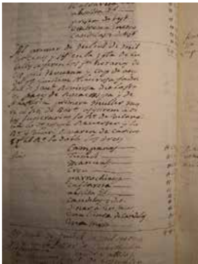
Notes. Foto 3

M'imagino que, un cop mort, en Guillem deuria ser portat al dipòsit de cadàvers, que estava situat dins del recinte de l'hospital, que era conegut amb