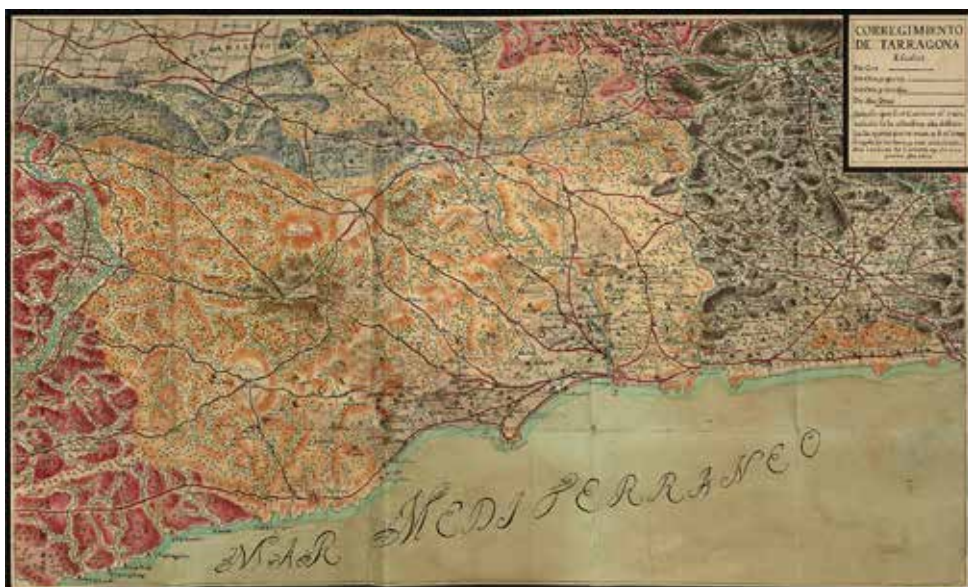
“Corregimiento de Tarragona 1716” amb Rocacrespa