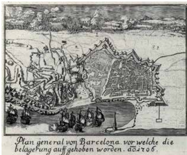
Aixacament del setge de Barcelona 1706

A les 7 del matí del dia 8, es comença a veure des de Barcelona una flota de vaixells aliats consistent en 53 vaixells de guerra i altres de transport.